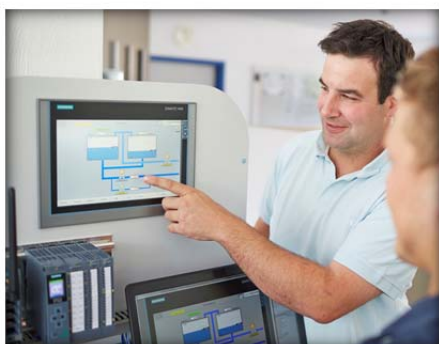
Projektierung | Automatisierung

Firmenangaben nach VOB/A mit Referenzen für unsere öffentlichen Auftraggeber in der Wasserwirtschaft