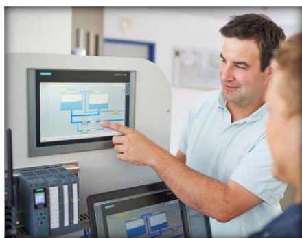
Projektierung | Automatisierung

Firmenangaben nach VOB/A mit Referenzen für unsere öffentlichen Auftraggeber in der Wasserwirtschaft